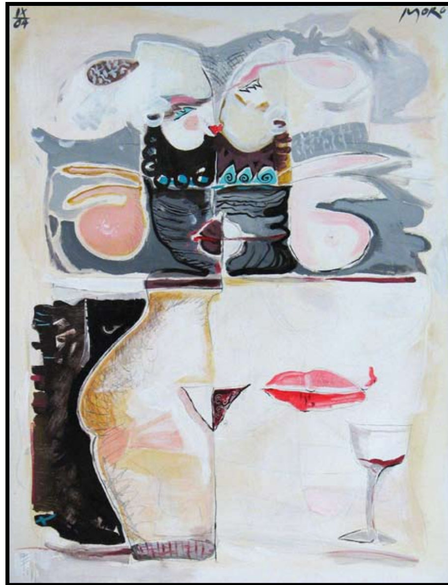
«Y Amor» 2004

119 x 90 cm Akryl på lerret med stålramme Acrylic on canvas with iron frame