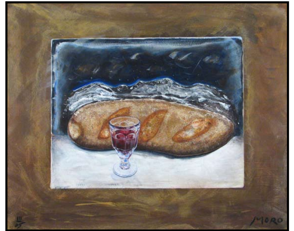
«Winternight with Bread and Wine» 2005

66 x 82 cm Akryl på lerret med stålramme Acrylic on canvas with iron frame