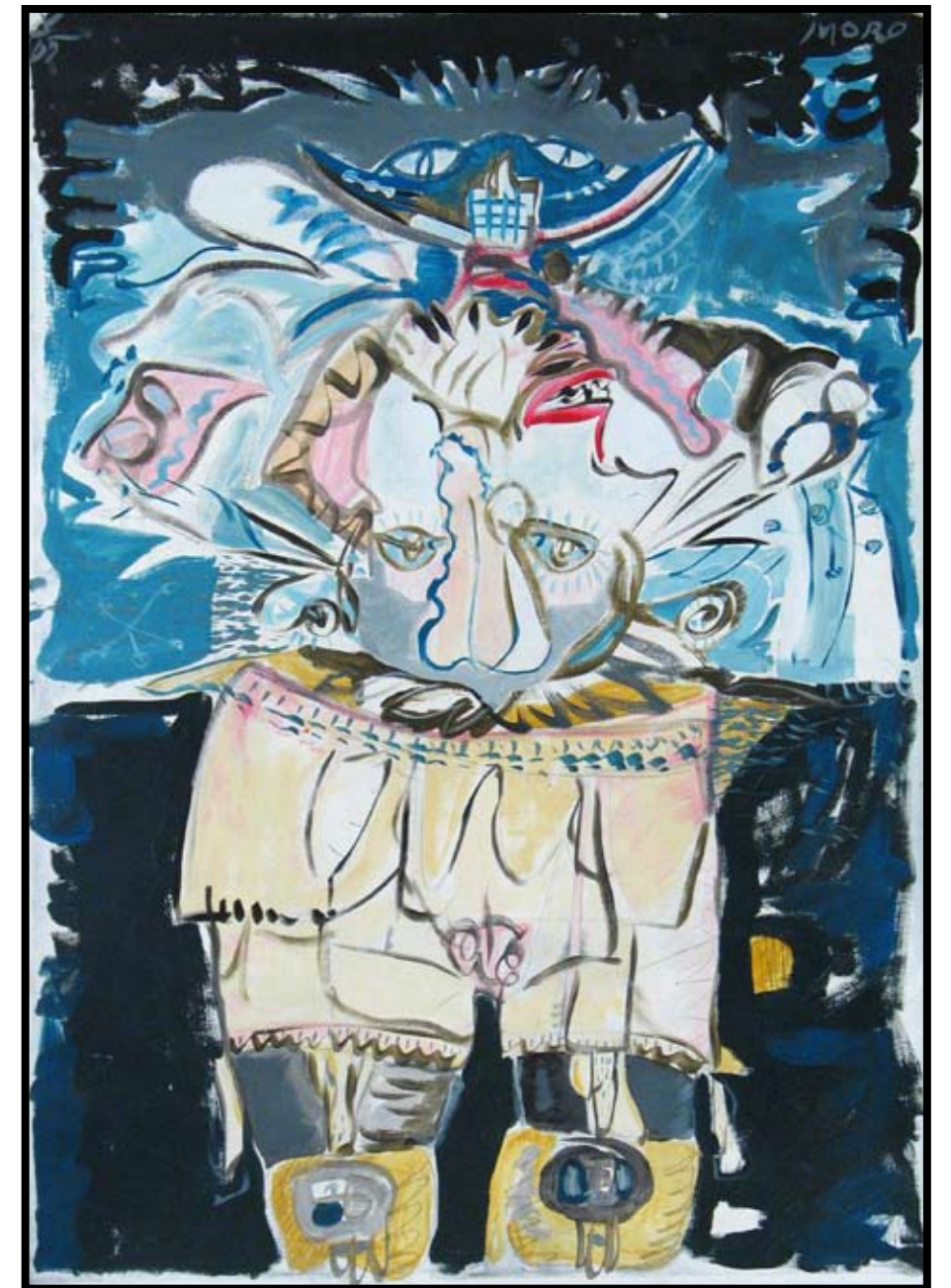
«Sur Measure» 2005

119 x 90 cm Akryl på lerret med stålramme Acrylic on canvas with iron frame